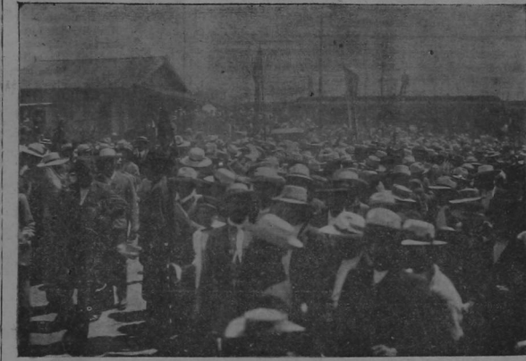
Parte del publico que se congregó en la estación de Cartago a recibir al Candidato s-nor Yglesias.

A ella asistí yo. Fueron los desesos del Jefe del Partido Civil, que de esta ciudad solamente le acompañaron unas veinte personas; para hacer el viaje, don Rafael habia pedido un carro expreso, pagado al tren ordinario de pasajeros. Mas, unos treinta o cuarenta civilistas, de los mas entusiastas, tomaron pasaje en el tren y a Cartago marcharon. A la salida del tren, el señor Iglesias fue aclamado por los civilistas que a despedirlo llegaron a la Estación y a sus compañeros de viaje.